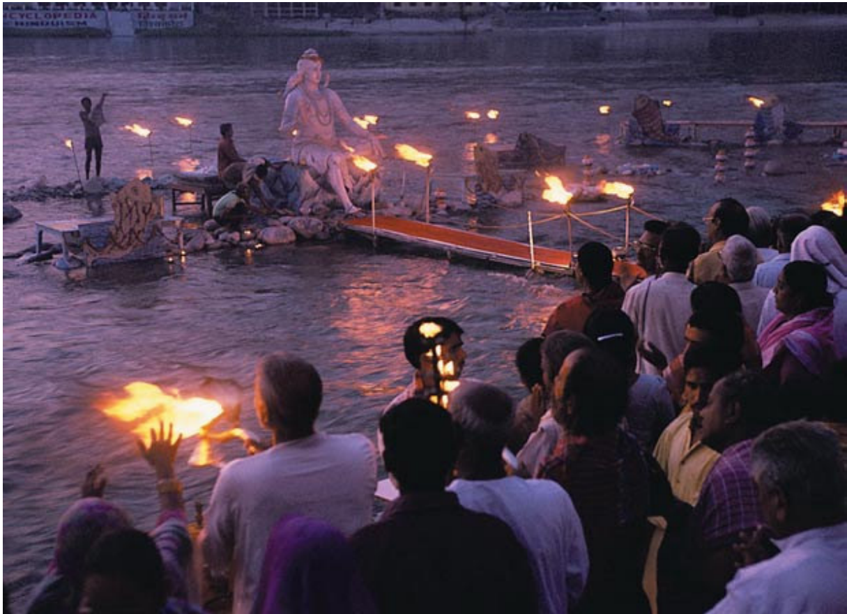
In de 'hoofdstad van de yoga' hangt er rond de Ganges behalve voorjaarsnevel ook spiritualiteit in de lucht.

N a een verblijf in de heksenketel Delhi, is het een verademing om in het vredige Rishikesh de benen te strekken op de witte stranden aan de oevers van de Ganges. Het is de eerste stad die de heilige rivier aandoet op haar tocht vanuit de Himalaya. Het water is azuurblauw en blaakt van gezondheid. Downtown Rishikesh heb ik snel achter mij gelaten om het sfeervolle, hoger gelegen gedeelte op te zoeken waar tientallen ashrams (traditionele yogaleerscholen) naast elkaar liggen. Gemotoriseerd verkeer is er uit den boze.